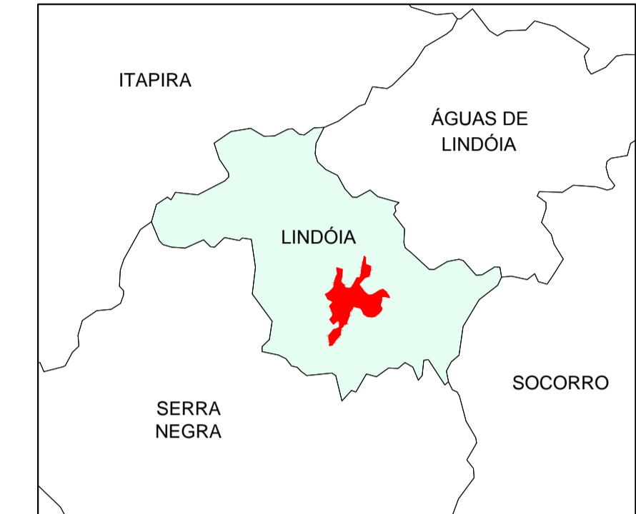
ÁREA DE ESTUDO